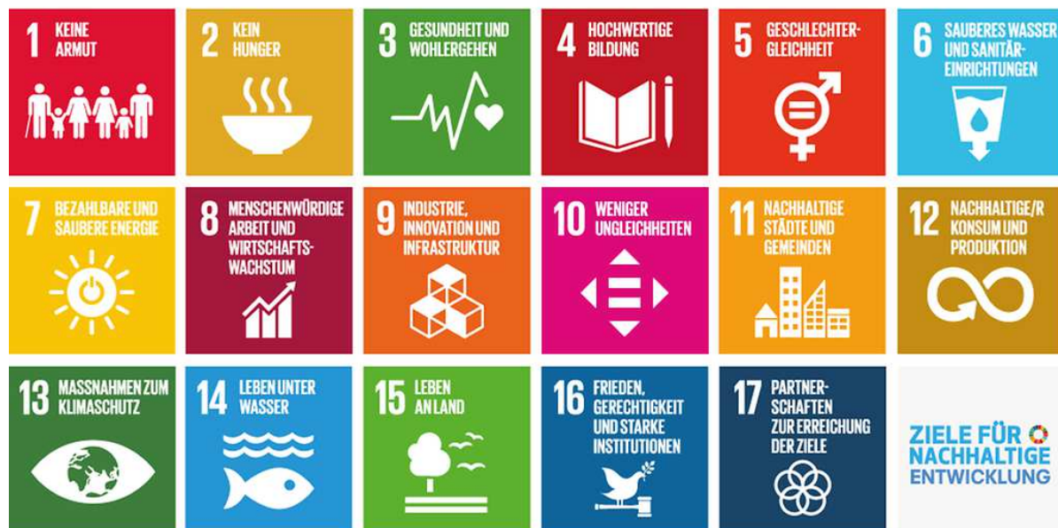
Abb. 2: Die Agenda 2030 für nachhaltige Entwicklung, beschlossen 2015 von den Vereinten Nationen

angesichts planetarischer Grenzen 29 . Ein dafür für notwendig erachteter Gesellschaftsvertrag solle „eine Kultur der Achtsamkeit (aus ökologischer Verantwortung) mit einer Kultur der Teilhabe (als demokratische Verantwortung) sowie mit einer Kultur der Verpflichtung gegenüber zukünftigen Generationen (Zukunftsverantwortung)“ kombinieren.