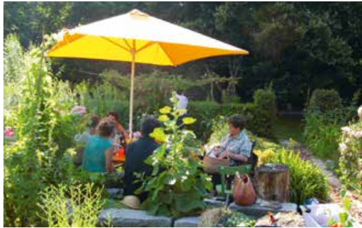
Abb. 2: Der Garten lädt zum Verweilen ein

ben entwickelten sich der Interkulturelle Frauengarten und der Wabengarten, der verschiedenen Initiativen wie dem Bund Naturschutz oder Radio Lora zur Verfügung steht. Seit 2012 gärtner eine Gruppe unbegleiteter minderjähriger Flüchtlinge innerhalb eines Projektes vom MUZ und dem Verein Hilfe von Mensch zu Mensch (vgl. Abb. 4).