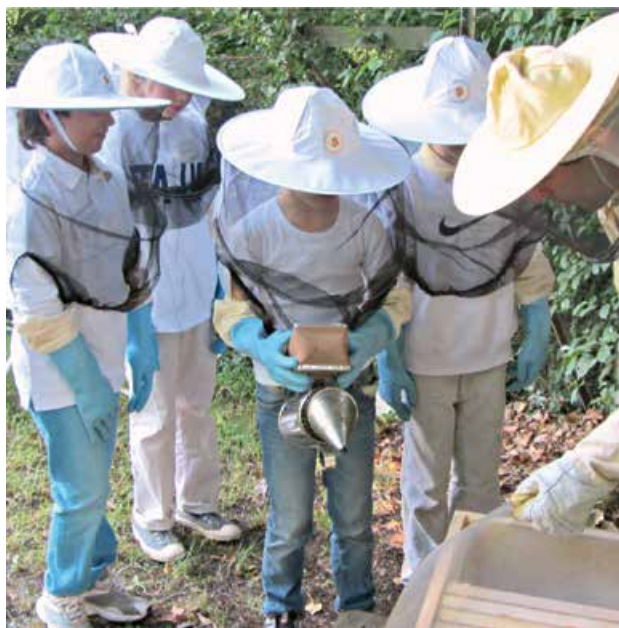
Abb. 1: Grundschulkindern beim „Stadtimkern“

Die Stadt bietet Bienen erstaunlich gute Lebensbedingungen. In Parks und Gärten blüht es vielfältig,