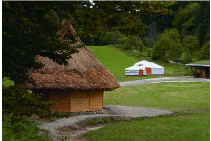
Abb. 3: Ruka und Gers © Nationalparkverwaltung Bayerischer Wald Wildniscamp am Falkenstein

Zur Einbindung der lokalen Bevölkerung in der Nationalparkregion wurden Patenschaften für einzelne Hütten an Organisationen wie den BUND und LBV, ein Jugendcafé, eine Volkshochschule und die Pfadfinder vergeben. Ein Austausch dieser Paten mit Gruppierungen aus den jeweiligen internationalen Schutzgebieten findet regelmäßig von internetbasierten Kontakten bis hin zu persönlichen Begegnungen statt. So entstand z. B. ein selbstorganisierter Jugendaustausch des Jugendcafés Zwiesel (ein offener Jugendtreff) mit der Regenwaldschule in der Region des Paria Nationalparks in Venezuela.