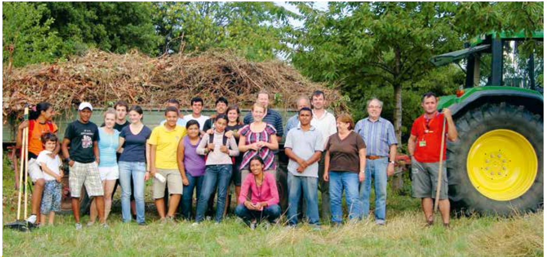
Abb. 3: Besuch in Deutschland: Gemeinsame Pflegeaktion mit dem NABU

Jugendlichen und das offizielle Feedback, etwa durch die Auszeichnungen als UN-Dekade-Projekt (siehe Projektdaten).