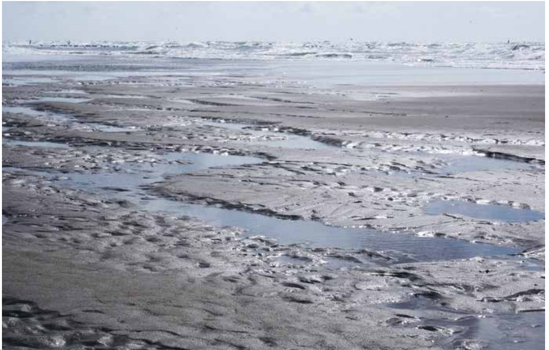
Abb. 5: Naturlandschaft in Europa – Das Wattenmeer an der niederländischen Insel Texel

Das Themenfeld Naturlandschaften und Wildnis bietet vernetzte Fragestellungen für eine Bildung für nachhaltige Entwicklung, u. a.: