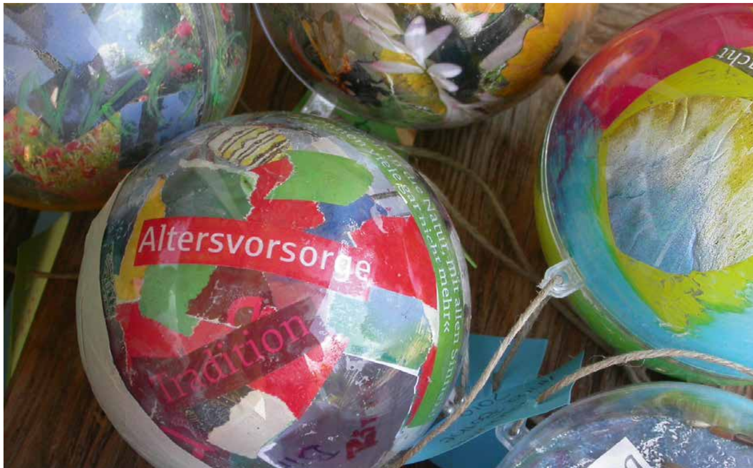
Foto 3: ZeitKapseln, in diesem Fall: Biodiversität als „Altersvorsorge“