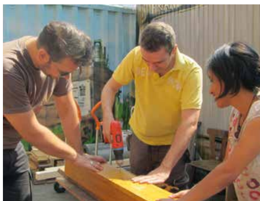
Abb. 4: Erwachsene Helfer engagieren sich beim Bau von Wildbienenhotels

Das Bienenretter-Projekt hat sich seit Bestehen sehr schnell entwickelt. Die stetig größer werdende Nachfrage nach Workshops und Veranstaltungen übersteigt die derzeitige Kapazität der