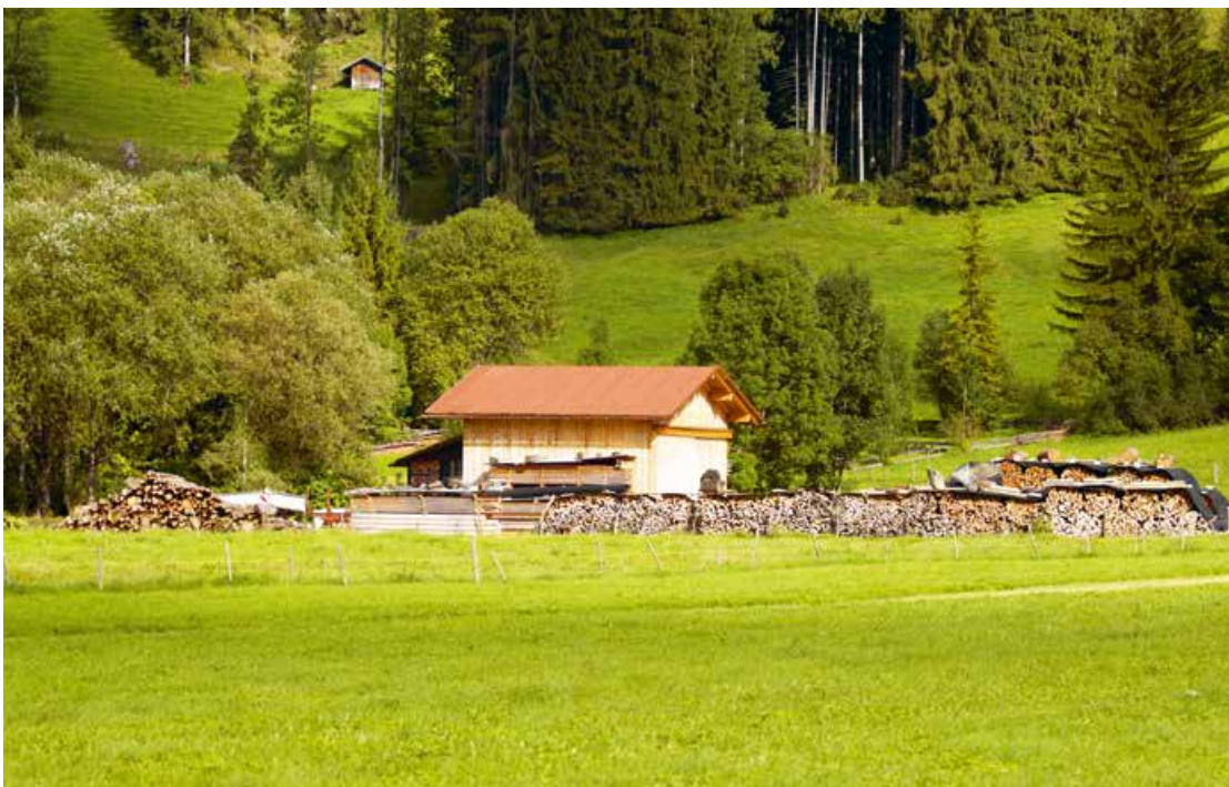
Abb. 4: ... und eine Landschaft mit Weideland und Baumbestand zum Erhalt bäuerlicher Strukturen in Oberstdorf, Allgäu

→ www.bmz.de/de/was_wir_machen/themen/umwelt/biodiversitaet/arbeitsfelder/agrobiodiversitaet/ (letzter Zugriff 02.01.2015)