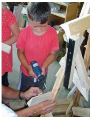
Abb. 3: In der Holzwerkstatt der Kita

Sogar nach Brasilien führt die Kinder dieses Projekt: Von brasilianischen Gästen in der Pfarrgemeinde erfahren sie viel über die Wälder und die Menschen in Brasilien. Das macht sie neugierig. Ein Blick auf den Globus, wo Brasilien liegt (vgl. Abb. 2), und eine imaginäre Flugreise kann beginnen. Kaum sind die Kinder „gelandet“, gehen sie auf Entdeckungsreise und sehen Dinge, die ihnen bekannt vorkommen: Kakao, Orangen, Cashewnüsse. All diese Dinge essen sie oft zu Hause. Dass diese Produkte aus Brasilien kommen, hätten sie nicht gedacht. Die Kinder erfahren, dass das Leben in Brasilien ganz anders ist als in Deutsch-