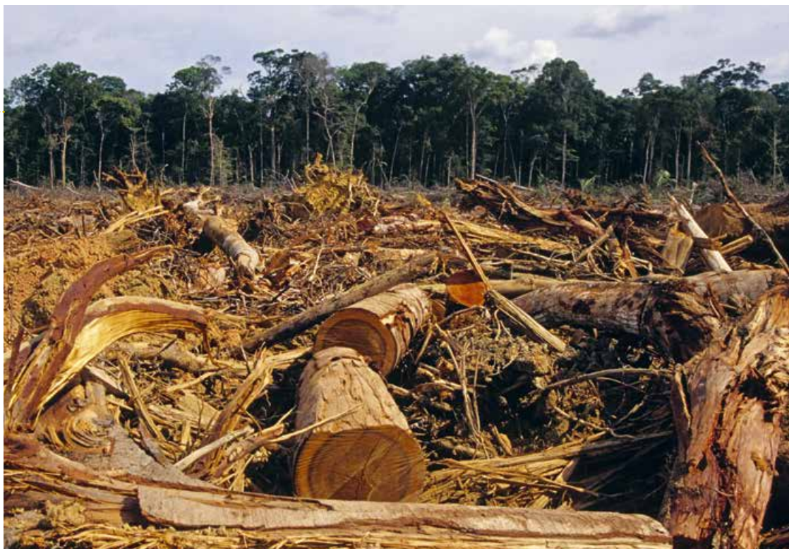
Abb. 1: Kernprobleme des globalen Wandels: Zerstörung des Tropischen Regenwaldes im Amazonasgebiet...

Auch der Wissenschaftliche Beirat der Bundesregierung Globale Umweltveränderungen (WBGU) verweist seit seinem ersten Gutachten 1993 immer wieder deutlich auf die globalen Bedrohungen: „Erstmals in der Geschichte wirkt sich menschliches Handeln auf die Erde als Ganzes aus. Die daraus resultierenden globalen Umweltveränderungen