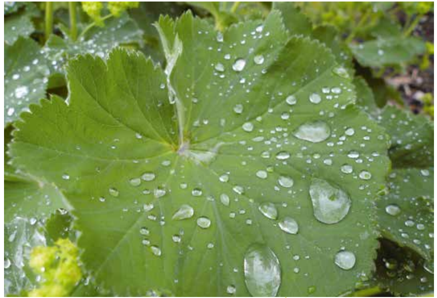
Abb. 8: Lotus-Effekt auf einem Frauenmantel, einer Pflanze mit kelchartig gelappten Blättern.

Enge Korrelationen zum Funktionswert zeigt der wirtschaftliche Nutzwert: So ist die Menschheit auf vielfältige Ökosystemleistungen für Produktions- und Konsumzwecke angewiesen (z. B. Nahrung, Holz, Erholung, Naturerlebnis, Gesundheit). Direkt erkennbar ist der wirtschaftliche Nutzwert bei der Land- und Forstwirtschaft sowie der Fischerei. Dabei liefert die genetische Variabilität von Nutzpflanzen auch Potenziale zur Risikominimierung, z. B. hinsichtlich Pflanzenkrankheiten und Schädlingsbefall. Um diese Leistung langfristig zu sichern, ist der Erhalt der Wildformen und möglicherweise „unwirtschaftlicher“ Sorten und Rassen unverzichtbar. Die Bedeutung von Wildpflanzen zeigt sich nicht zuletzt bei Heilpflanzen, die eine herausragende Bedeutung für unsere Gesundheitsversorgung haben: Weltweit nutzen