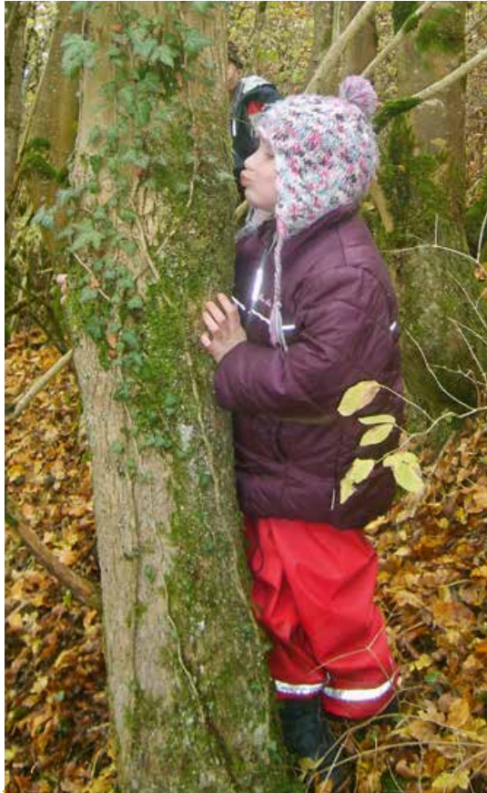
Abb. 1: Mein Lieblingsbaum!