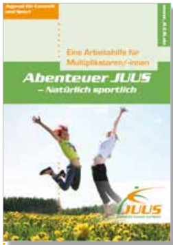
Abb. 2: Arbeitshilfe für Multiplikatoren

sowie die Durchführung von Wettbewerben (JUUS-Freizeiten). Bei den Modellfreizeiten stehen z. B. jeweils verschiedene Sportarten wie Kanu, Tauchen, Reiten, Ballonfahren und Inlineskating und die jeweiligen Landschaftstypen, in denen sie durchgeführt werden, im Mittelpunkt.