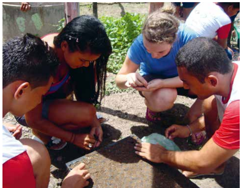
Abb. 2: Besuch in Brasilien: Gemeinsames Setzen von Samen

Deutschland zählt laut dem Index für menschliche Entwicklung zu den sehr hoch entwickelten Staaten. Das bevölkerungsreiche Schwellenland Brasilien leidet dagegen unter einer stark ungleichen Einkommensverteilung und sozialer Ungleichheit. Vor diesem Hintergrund haben sich die Jugendlichen aus beiden Ländern eigenständig eine Netzwerkstruktur erarbeitet. Sie erlernten und nutzen Praktiken wie Spendenakquise, Buchhaltung und Logistik und etablierten zahlreiche, auch internationale Kooperationen, um die gemeinsamen Projekte umzusetzen. Dabei binden sie Expertinnen und Experten aus verschiedenen Fachrichtungen – Sozialverbände, Naturschützer, Techniker, Förster, Handwerker und Landwirtschaftsinstitute – ein, um interdisziplinäre Lösungen zu finden. Motivation für eine Verstärkung der seit 2007 etablierten Netzwerke sind die positiven Erfahrungen der