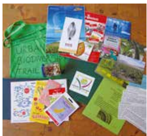
Foto 3: Forschertasche zum „Lehr- und Lerngarten“ mit Statements rund um Saatgut, Fotos zu in-/ex-situ Erhaltung, Werbung von Saatgutherstellern, einem Glas mit Samen für die kreative Aufgabe

Es folgt eine Phase der Teamarbeit an acht Lernorten in der Stadt Witzhausen. Hierfür erhalten die Teilnehmer/innen eine Forschertasche mit Materialien (vgl. Foto 3). Jede der acht Gruppen besucht und bearbeitet jeweils zwei Lernorte. Die Stationen ermöglichen unterschiedliche Blickwinkel auf das Thema Pflanzenvielfalt. Jede Gruppe erhält einen Stoffbeutel, der unterschiedliche „Anstöße“ enthält, um selbstständig die Thematik zu bearbeiten. Dazu gehören z. B. Anschauungsmaterial, gekürzte Zeitungsartikel oder Fotos für beide Stationen. Das Material hilft beim Beantworten von bis zu zehn inhaltlichen Fragen pro Standort, es gibt aber keine „richtigen“ Antworten vor. Die Fragen sind auf Knickzetteln abgedruckt, die in