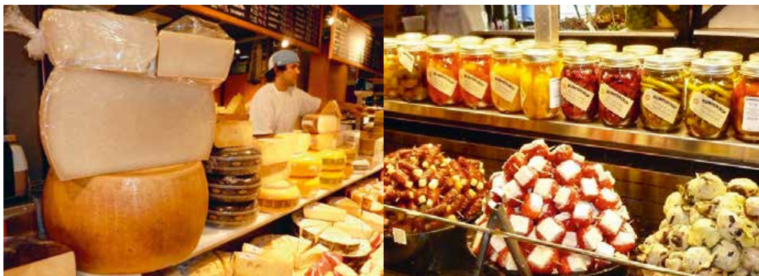
Abb. 11: Ein Lebensmittelangebot in Hülle und Fülle, wie es nicht nur in Toronto/Kanada zu finden ist.