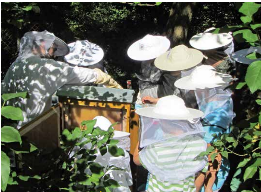
Abb. 2: Beobachten und diskutieren: Was können wir als Klassenverband von den Bienen lernen?

Schulen und Kooperationspartner haben die Möglichkeit, unser Projekt in den Unterricht oder spezielle Programme zu integrieren. Veranstaltungen werden mit diesen Partnern stets abgestimmt. Unternehmen und Organisationen können sich ohne großen organisatorischen und finanziellen Aufwand im Rahmen ihrer sozialen Verantwortung (CSR) beteiligen – sei es über den Kauf der Produkte, eine Bienen-Patenschaft oder einen „Social-Day“.