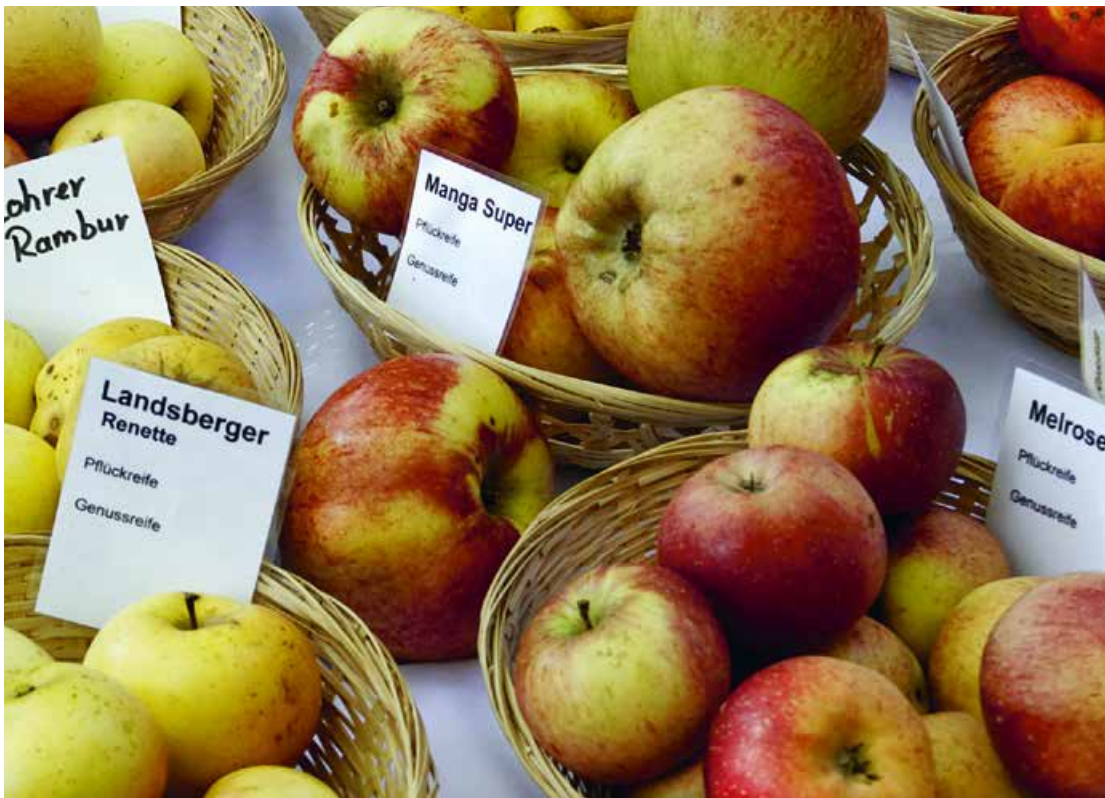
Abb. 14: ... und Äpfel in Deutschland © iStock.com/Hohl