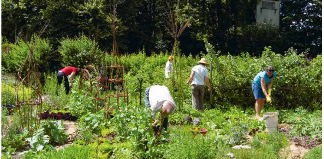
Abb. 1: Die Experimentiergärten – Ergebnis von Beteiligungsprozessen