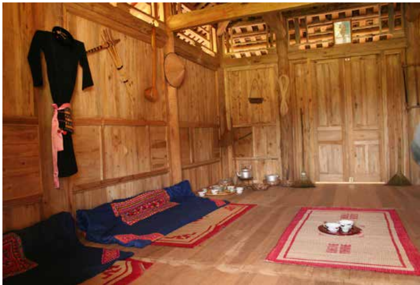
Abb. 2: Einrichtung Vietnamesisches Langhaus

Haushaltsgeräten, Wohneinrichtung und Ernährung. Der subjektiv erfahrene Komfortverzicht soll deutlich machen, wie eine sinnvolle – da nachhaltigere – Anpassung an gegebene Lebensbedingungen in anderen Kulturen und an anderen Orten aussieht. Eine ganztägige Wanderung im Nationalpark rundet das Programm ab. Auch hier verlassen die Jugendlichen ihre aktuelle Komfortzone im Camp und erfahren die regionale biologische Vielfalt bzw. das Thema Wildnis mit allen Sinnen. Eine pädagogische Begleitung wird durch qualifizierte Mitarbeiterinnen und Mitarbeiter des Wildniscamps bzw. des Nationalparks geleistet. Das Angebot kann ähnlich wie eine Klassenfahrt gebucht werden. Dabei können die Jugendlichen auch zu vorgegebenen Themen wie kulturelle und biologische Vielfalt, globaler Klimawandel, ökologischer Fußabdruck und Lebensstile arbeiten.