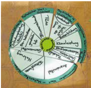
Foto 2: Das Biodiversitätspuzzle führt inhaltlich in den Begriff ein, verdeutlicht den „Wert“ und Nutzen der Vielfalt

Zuerst hören die Teilnehmerinnen und Teilnehmer einen kurzen, durchaus provokanten Radiobeitrag (*Mit freundlicher Genehmigung des SWR, Axel Weiss, 2013), der etwas überspitzt verdeutlicht, wie oft wir völlig selbstverständlich die Dienstleistungen von Biodiversität hinnehmen und uns nur wenig Gedanken über den Verlust biologischer Vielfalt machen („Haben Sie deswegen ein Steak weniger gegessen oder einen Euro weniger verdienen können?“) oder wie wenig wir – angeblich – vom Verlust „nichtsnutziger Unkräuter“ und „igitt-Spinnen“ betroffen sind. Danach legen die Teilnehmerinnen und Teilnehmer drei Puzzles (vgl. Foto 2) rund um die Begrifflichkeit Biodiversität: „Was ist das überhaupt?“ „Wozu brauchen wir Biodiversität?“ „Welche Werte stecken hinter den Dienstleistungen biologischer Vielfalt?“. Auch lernen sie die grüne Pappbrille kennen, die als „Biodiversitätsbrille“ das Ziel der Veranstaltung verdeutlicht: genau hinschauen, die Augen öffnen und eigene Bezüge, aber auch persönliche Handlungsmöglichkeiten erkennen.