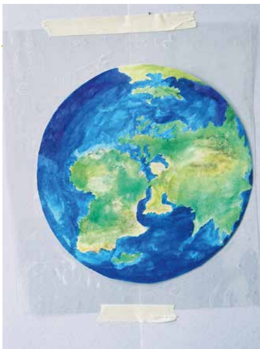
Foto 1: Die Welt, gemalt von einer beteiligten Schülerin