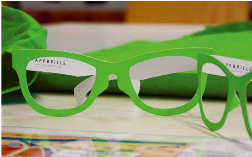
Foto 1: Genau hinschauen, Augen öffnen, Vielfalt erkennen: Die Biodiversitätsbrille