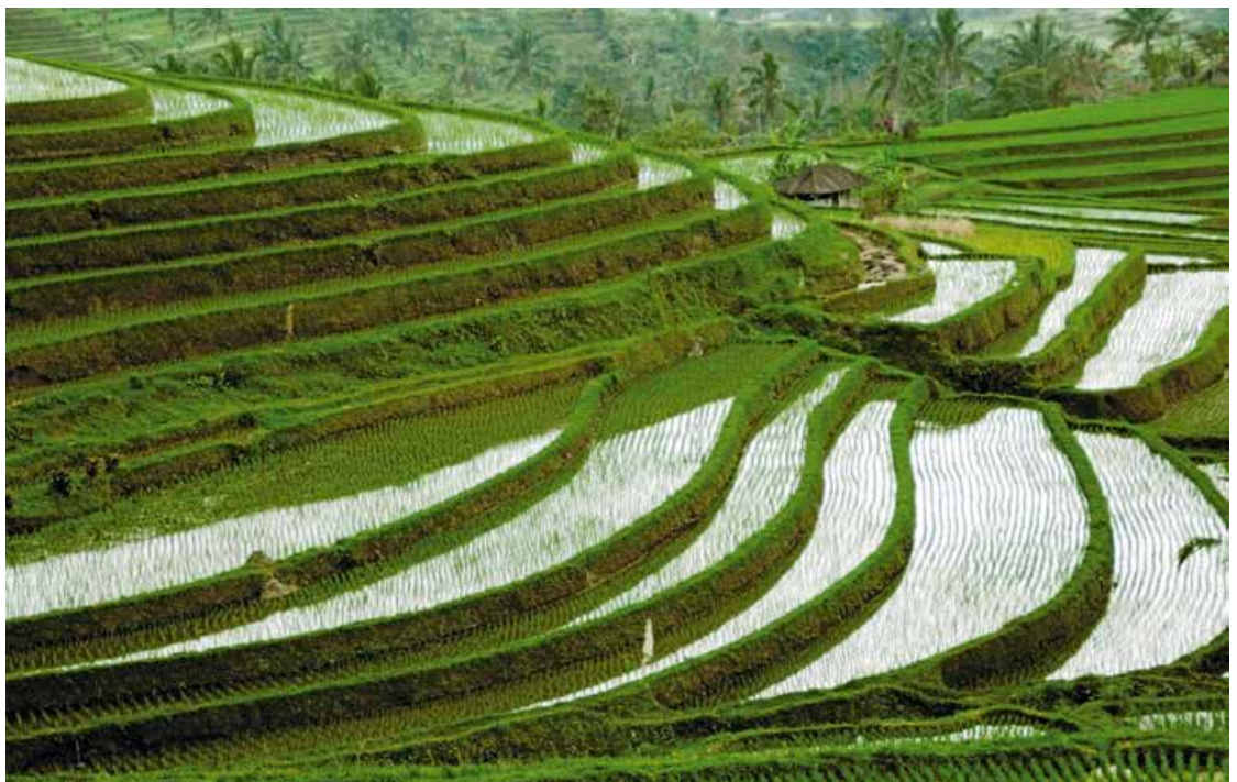
Abb. 3: Die Jahrhunderte alten Reisterrassen von Jatiluwih, Bali ...

Zunehmende Beachtung finden inzwischen die Auswirkungen „gebietsfremder“ (invasiver) Arten, die seit der Neuzeit entweder durch Aktivitäten des Menschen – gewollt oder ungewollt – in vorher von ihnen nicht besiedelte Gebiete eingeführt wurden oder selbstständig eingewandert sind. Damit setzte ein bisher nicht da gewesener weltweiter Austausch an Faunen- und Florenelementen ein, der zum Transfer von Organismen in Regionen weit außerhalb ihrer natürlichen Verbreitungsgrenzen führte und bis heute führt. Die Einbringung nichtheimischer Arten gehört – nach dem Verlust von Lebensräumen infolge von Landnutzungsänderung – weltweit betrachtet zu den wichtigsten Bedrohungen für die biologische Vielfalt (WBGU 2000: 194; ebd. Glossar). Wie jüngste Schätzungen des EU-Parlamentes aus dem Jahr 2014 zeigen, verursachen „invasive gebietsfremde Arten [...] einen Scha-