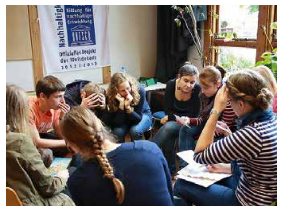
Foto 5: Die Teilnehmenden reflektieren die Arbeit an den Stationen und tauschen Ergebnisse aus

Der Urban Biodiversity Trail entstand im Sommer/Herbst 2013. Während der Entwicklungsphase fanden drei Probeläufe statt, deren Evaluierungen jeweils Änderungen von Inhalt, Methoden und Ablauf bewirkten. 2014 wurde der UBT in das reguläre Veranstaltungsangebot von WeltGarten Witzenhausen aufgenommen. Eine Multiplikator-schulung im November 2013 sorgte dafür, dass außer der Entwicklerin noch weitere Personen das Programm durchführen können. Seither fanden fünf weitere Veranstaltungen statt. Die Schulen im Umkreis sind durchaus interessiert, schrecken aber bereits im Anmeldungsgespräch vor allem vor der Dauer der Veranstaltung aber auch vor den Kosten (100 € /Modul plus Anreise) zurück. ■