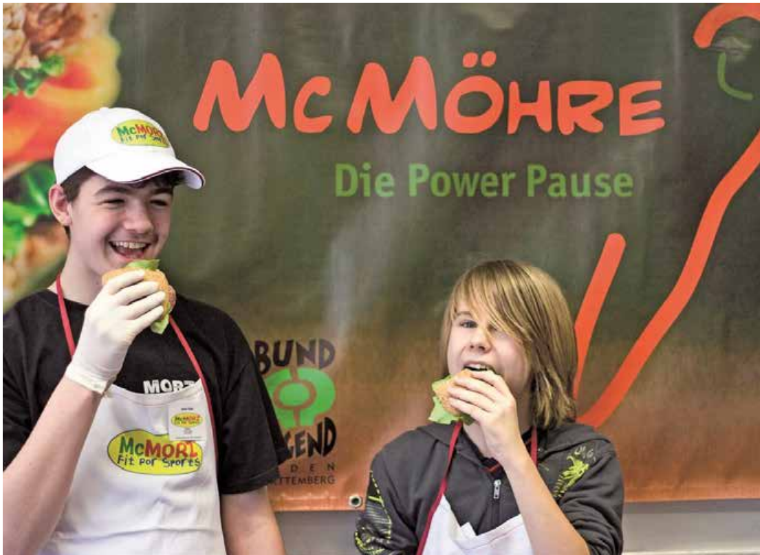
Abb. 1: McMöhre – hier schmeckt die Pause in Zell im Wiesental