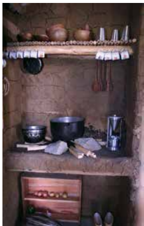
Abb. 4: Einrichtung der Küche der venezolanischen Cabana

Insgesamt kombiniert das Projekt ökologische Themen mit dem Ansatz einer Bildung für eine nachhaltige Entwicklung: Über die Länderhütten wird das Prinzip Lernen vor Ort mit unterschiedlichen kulturspezifischen Kontexten verbunden.