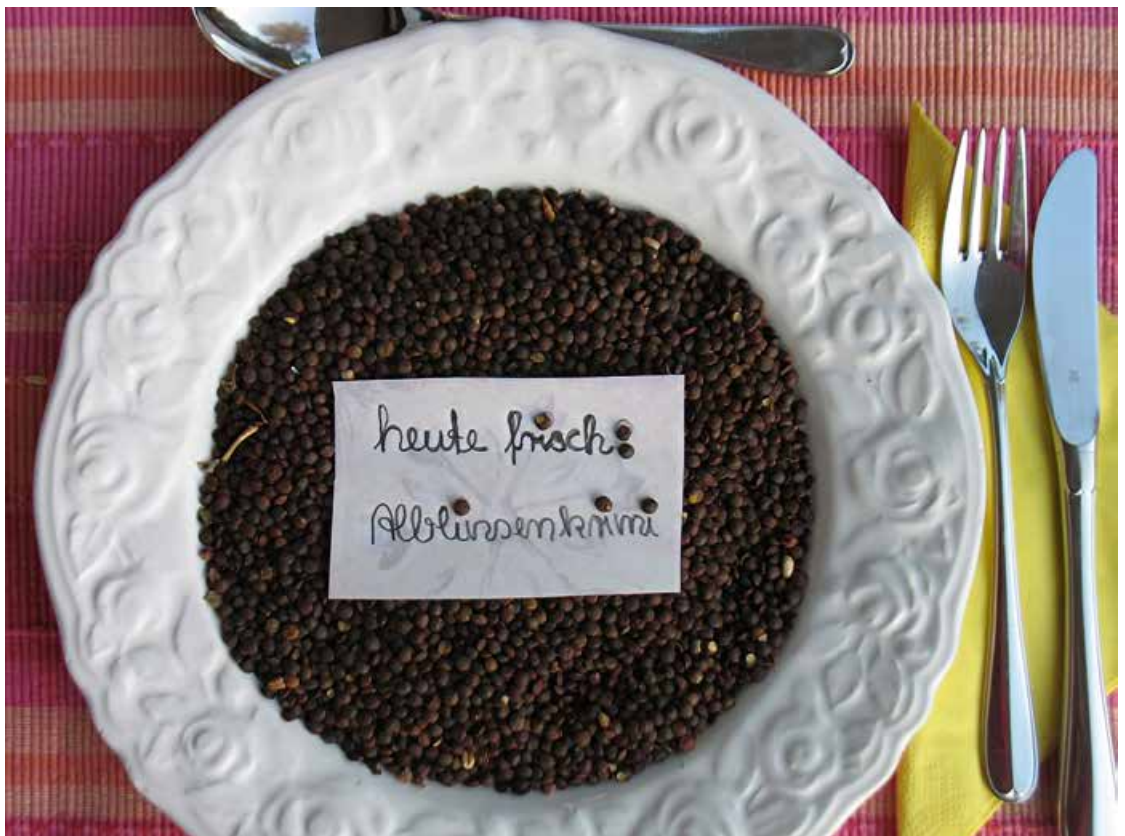
Abb. 2: Der Weg zum Original führte zu einer russischen Samenbank. Heute erobert die Alblinse nicht nur Gourmetsungen

McMöhre Schülerfirmen findet man inzwischen an 14 Schulen. Diese Schulen haben zwischen 30 und bis zu 1000 Schülerinnen und Schüler; die Schülerfirmen arbeiten mit Kooperationspartnern und Eltern zusammen. „Nebenbei“ erreicht man über das Projekt McMöhre die Geschwister und Eltern der „MitarbeiterInnen“. Es entwickelten sich Kooperationen mit lokalen Wirtschaftsunternehmen, Verbänden und Behörden. Einige Schülerfirmen erhalten fair gehandelte Produkte aus dem Eine-Welt-Laden oder kleinen Bioläden, andere haben mit dem Supermarkt vor Ort verhandelt, um Bioprodukte zu einem guten Preis erwerben zu können. Die „Übergabe“ der Schülerfirmen an die nachfolgenden Klassen klappt nach ersten Rückmeldungen sehr gut. Einige Schülerfirmen wurden für größere Aufträge „gebucht“ – z. B. für die Ver-