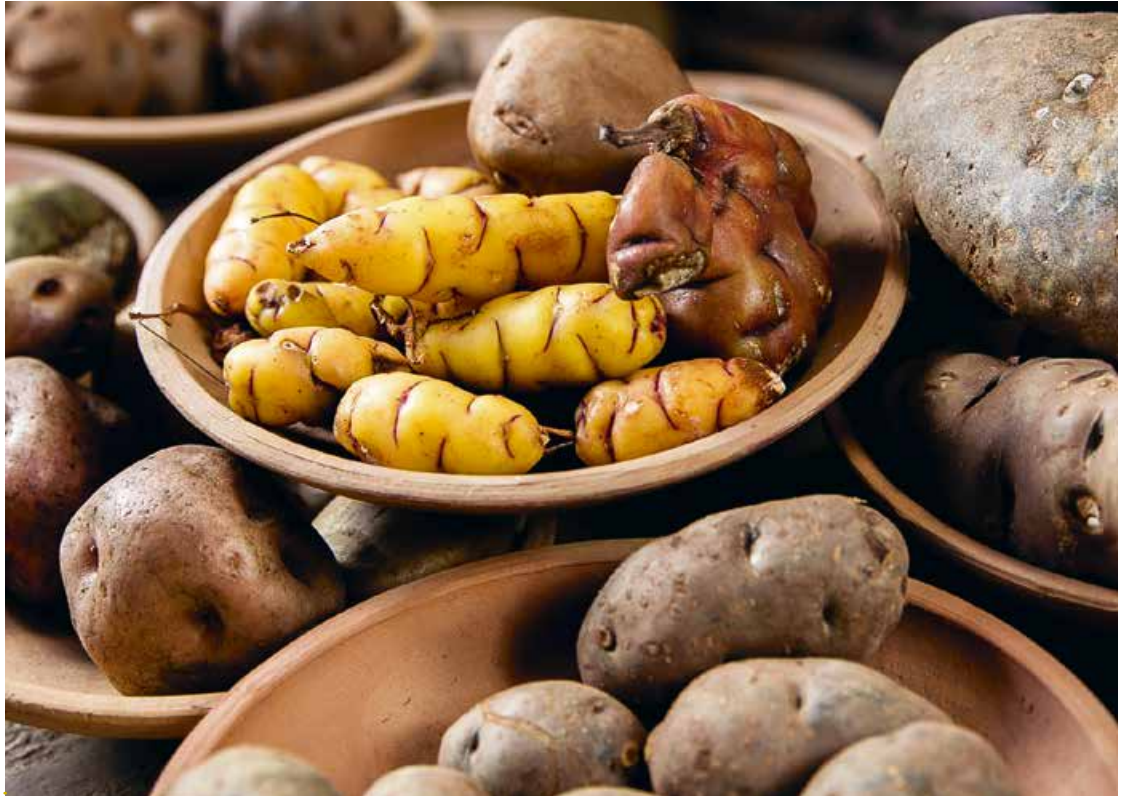
Abb. 13: Biologische Vielfalt in unterschiedlichen Ländern wahrnehmen und wertschätzen: Kartoffeln in Peru ...