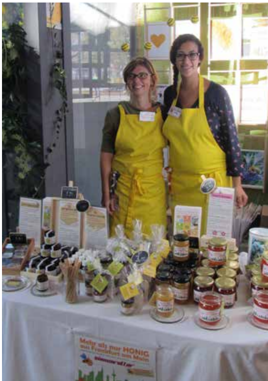
Abb. 5: Verkauf von selbst hergestellten Produkten auf dem „Heldenmarkt“, der Messe für nachhaltigen Konsum

Schutz genoss, wurde 2013 Bienenretter beim Deutschen Patentamt als Wortmarke eingetragen, so dass kein Missbrauch durch Dritte möglich ist. Auch dies ist ein bedeutender Schritt für das Projekt.