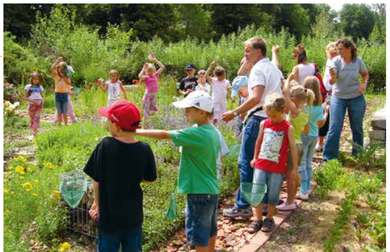
Abb. 6: Schulklassenprogramm im Experimentiergarten