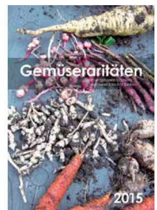
Abb. 5: Kalender Gemüseraritäten 2015

In Workshops können Teilnehmende z. B. beim Färben mit Pflanzenfarbstoffen ein „Blaues Wunder erleben“ oder beim Herstellen von Lippenbalsam oder Ölfarbe aus Nawaros (Nachwachsende Rohstoffe) den „Ölwechsel“ vom Erdöl zu