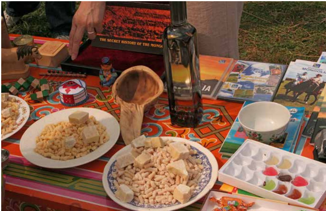
Abb. 5: Mongolische Spezialitäten: Süßigkeiten aus vergorener Stutenmilch, die den Geschmackshorizont erweitern und eng verbunden sind mit dem nomadischen Lebensstil

Dabei steht die Stärkung der Gestaltungskompetenz der beteiligten Akteure im Vordergrund. Jugendliche erleben einen kulturellen Perspektivwechsel und erarbeiten sich eigenständig globale Themen und lokale Handlungsansätze. Das Verständnis für den zunehmend stärkeren globalisierten Wirkungszusammenhang von vermeintlich weit entfernt wirkenden Phänomenen der natürlichen Umwelt (Klimawandel etc.) wird gefördert.