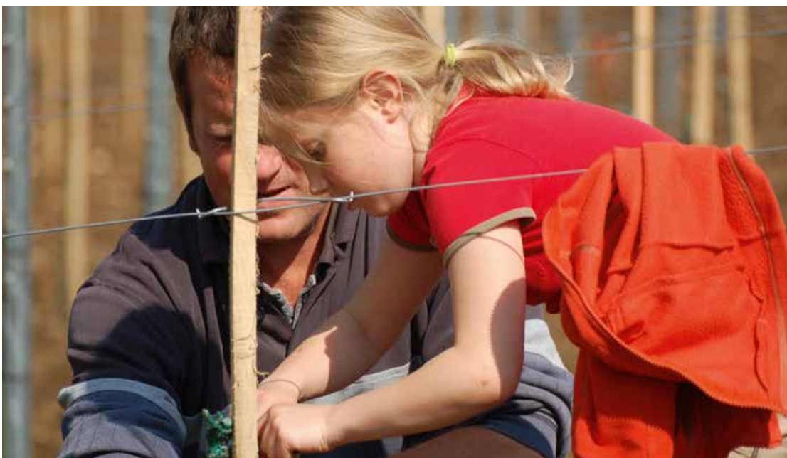
Abb. 1: Alles fängt klein an: Mit großer Sorgfalt pflanzen die Kinder mit den Winzern junge Reben in „ihren“ Weinberg