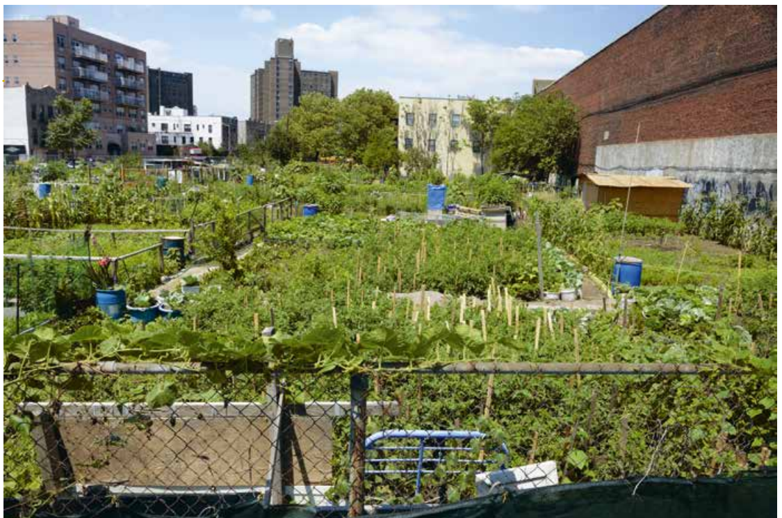
Abb. 7: Urbane Landwirtschaft in Coney Island, New York