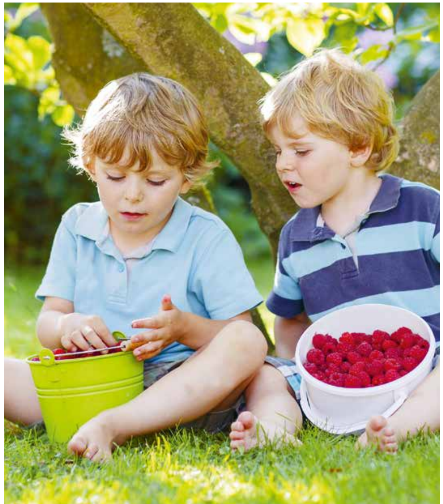
Abb. 12: Natur erleben und schmecken

Das Mensch-Natur-Verhältnis ist für den Umgang mit Natur relevant und manifestiert sich letztlich immer im Verhalten – sei es als Schutz, Nutzung oder auch Zerstörung von Natur. Auch unsere