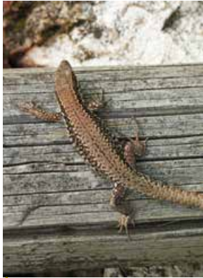
Abb. 2: Mauereidechse ( Lacerta muralis ), die einen alten Rebpfahl erklimmt