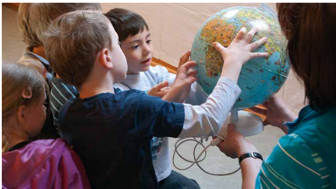
Abb. 2: Wer findet Brasilien auf dem Globus?

Die unmittelbare Naturerfahrung ermöglicht ein Lernen mit allen Sinnen und schafft emotionale Zugänge zur Natur. Gleichzeitig werden Anlässe geschaffen, Fragen zu stellen und das Wissen um Natur und ihre Bedeutung für uns Menschen zu fördern (Kohler, 2014). Diesem Ansatz folgt das vorliegende Projekt. Schon mehrfach war die Kitagruppe aus Pappenheim (Bayern) im Wald. Die Kinder hatten sich zum Spielen einen besonderen Platz mit einem besonders eindrucksvollen Baum gesucht. Aber ist nicht jeder Baum auf seine Art eindrucksvoll? Dieser Frage gingen die Kinder nach und jedes Kind suchte sich seinen „eigenen“ Baum (vgl. Abb. 1). Durch mehrere Waldbesuche hatten sie Zeit „ihren“ Baum kennenzulernen: Wie fühlt er sich an? Wie groß ist er? Hat er Blätter oder Nadeln und wie sehen diese aus? Ist er mit Moos bewachsen? Ist es ein dicker oder ein dünner Baum? Wie sehen seine Früchte aus? Natürlich tauschten sich die Kinder über „ihre“ Bäume aus und lernten so schnell die wichtigsten Baumarten im heimischen Wald kennen. Aber nicht nur die Artenkenntnis stand im Vordergrund. Es entstanden Geschichten und Spiele rund um die Bäume und auch Bilder wurden gemalt. Die Kinder entwickelten so eine emotionale Beziehung zu ihren Bäumen.