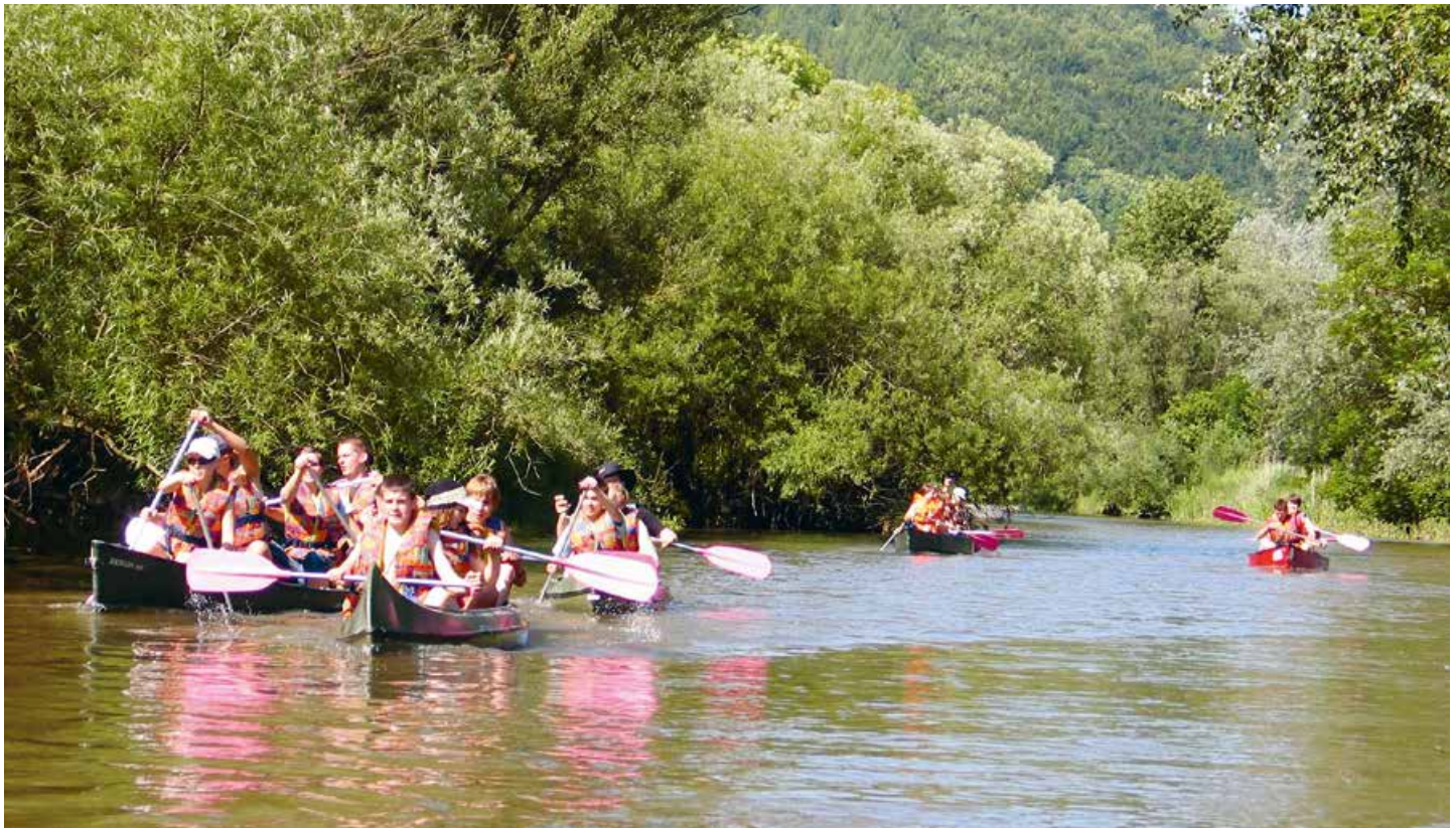
Abb. 1: Beim Kanufahren Flusslandschaften aktiv erleben, schätzen und schützen lernen © Uwe Biermann