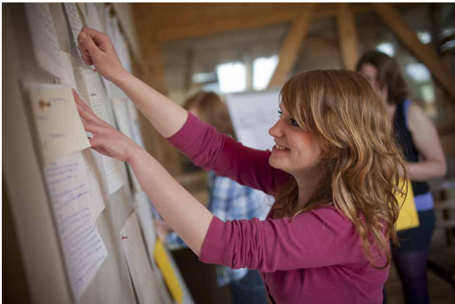
Foto 2: Szene aus einer der Projekt-Schreibwerkstätten