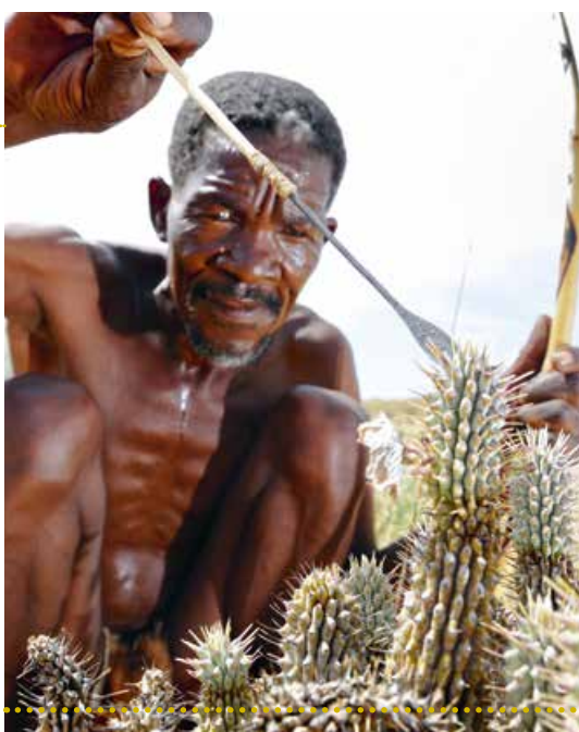
Abb. 10: Ein Ureinwohner erntet einen Teil der Hoodia-Pflanze.

Um häufigen Missverständnissen in Bezug auf das Ziel dieser ökonomischen Betrachtung zu begegnen, sei aus dem Leitbild der Studie hervorgehoben, „dass Biodiversität in all ihren Dimensionen – Qualität, Quantität und Vielfalt der Ökosysteme, Arten und Gene – nicht nur aus gesellschaftlichen, ethischen und religiösen Gründen erhalten werden (muss), sondern auch im Sinne des wirtschaftlichen Nutzens für heutige und künftige Generationen“ (TEEB 2010: 40, zit. nach Ring 2014: 132). Die Feststellung des monetären Wertes (vgl. Info-Kasten 8) macht dabei nur einen Teil des Projektes aus. Vielmehr geht es darum, Ökosystemleistungen insgesamt quantitativ und qualitativ zu erfassen, einschließlich der bekannten und noch unbekanntem Wissenslücken.