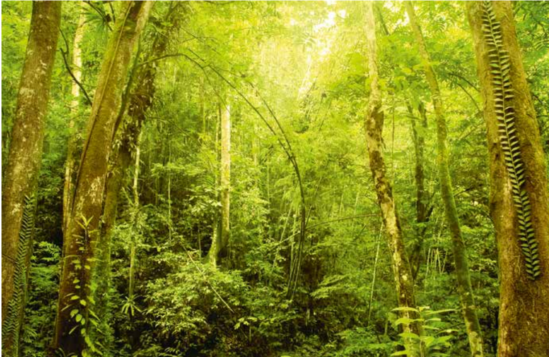
Abb. 6: Naturlandschaft in Asien – Tropischer Regenwald in Malaysia

häufig zur Förderung von Arten mit geringeren Ansprüchen an den Lebensraum und zum Verlust von seltenen Arten mit geringer Toleranz gegenüber Eingriffen in ihren Lebensraum führt.