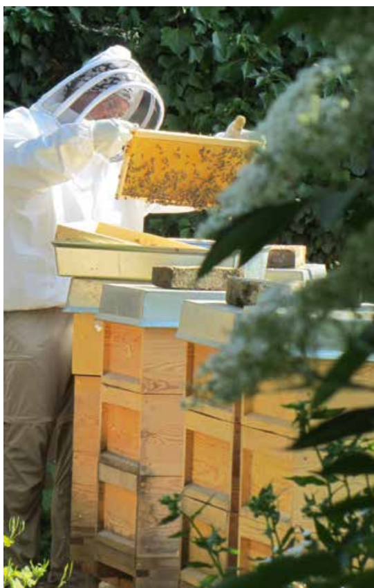
Abb. 3: Bienenhaltung im Bienenretter-Garten