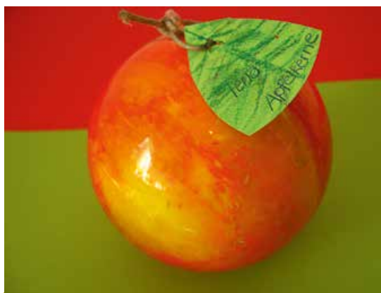
Foto 4: ZeitKapsel, die den Kern eines Apfels enthält: diesen Apfel soll es in 30 Jahren noch geben

Zum Beispiel enthält die SchatzKiste der Adivasi aus Indien kulturelle und regionale Objekte zu den Themen: Alltagsgegenstände von Frauen und Männern, traditionelle Kleidung und Schmuck sowie regionaltypische Nutz- und Heilpflanzen (vgl. Foto 5, Foto 6). Sie bietet Anknüpfungspunkte zu verschiedenen Fächern wie Biologie (Ernährung, traditionelle Nahrungs- und Heilpflanzen, Verständnis von Natur und Ökologie), Sozialkunde (Erziehung, Familie, ressourcenschonende