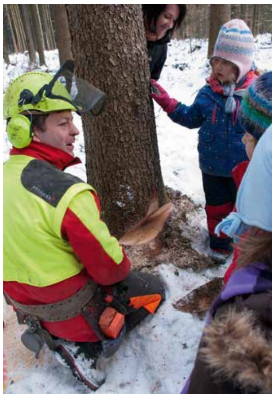
Abb. 4: Ein Baum wird gefällt! © Andreas Müller

wird, wenn nicht alle drei Aspekte in Entscheidungen berücksichtigt und abgewogen werden.