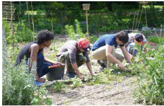
Abb. 4: Neu erden – Unbegleitete minderjährige Flüchtlinge

Bohnen immer wieder ausgesät werden. Ein Teil der Ernte wird von den Paten als Saatgut an die Gruppe zurückgeben, um diese im kommenden Jahr an andere Personen weiter reichen zu können. Die Münchnerinnen und Münchner werden somit in den Erhalt der Sorten mit einbezogen und für die Bedeutung der genetischen Vielfalt sensibilisiert.