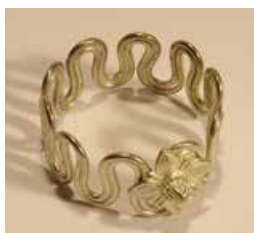
Foto 6: Traditioneller Schmuck der Adivasi aus Indien

Lebensweise) Geschichte (älteste Bevölkerungsgruppe Indiens, Gebräuche, Zeremonien, Einfluss der globalisierten Welt), Kunst/Handwerk (traditionelle Holzbildhauerei und Flechtarbeiten), Musik (Bedeutung von Liedern und Tänzen), Ethik/Religion (Wertvorstellungen, spiritueller Bezug zur Natur) und Geographie (u. a. Globalisierung/Globale Beziehungen und Abhängigkeiten).