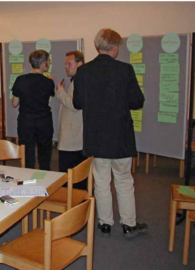
Abb. 3: Beteiligungsprozesse für die Freiflächengestaltung

einem eigenen Saatgutarchiv erhalten und im Eigenanbau sowie über Saatgut-Tauschbörsen weiter verbreitet. Aus der ehrenamtlichen Gartengruppe wurden engagierte Akteure der neuen Gartenbewegung, deren Aktivitäten und Vernetzung mit anderen Initiativen das politische Gewicht im Stadtteil gestärkt und Transformation von unten vorangebracht haben.