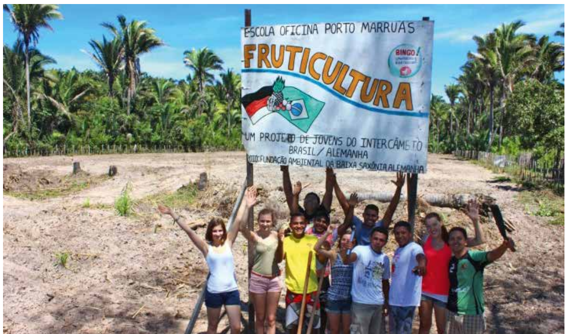
Abb. 1: Die Plantage in Brasilien ist für die Bepflanzung vorbereitet, der Brunnen gebohrt und die solarbetriebene Pumpe bestellt

Über das Projekt Brasil 09 wird deutschen und brasilianischen Jugendlichen ein langjähriger aktiver Austausch ermöglicht. In wechselseitigen Besuchen pflegen sie gemeinsam deutsche Streuobstwiesen und etablierten partnerschaftlich ein Bildungszentrum mit einer Werkstattschule für ökologischen Obstanbau in Nordostbrasilien (vgl. Abb. 1, Abb. 2). Mit dieser Schule werden Ausbildungsplätze für sozial benachteiligte Jugendliche in Porto/Piauí geschaffen. Zur Anlauffinanzierung sammelten die deutschen Schülerinnen und Schüler Fallobst und verkauften den daraus gepressten Direktsaft zugunsten der Obstkooperative in Brasilien. Im Sinne einer Hilfe zur Selbsthilfe trägt sich die Kooperative inzwischen aus eigenen Mitteln. Um einen ökologischen Ausgleich für die errichtete Obstplantage in Brasilien zu schaffen, wurden Regenwaldparzellen aufgekauft und dauerhaft gesichert. Zudem ist eine nachhaltige Energieerzeugung durch Solaranlagen auf den beteiligten Einrichtungen beider Länder geplant.