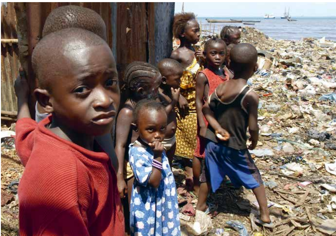
Abb. 2: ... und fehlende Bildungs- und Lebenschancen für Kinder im größten Slumgebiet von Freetown/Sierra Leone

Obwohl bereits mit der Agenda 21 bei der Konferenz in Rio 1992 formuliert, wurde erst mit dem Weltgipfel zur nachhaltigen Entwicklung in Johannesburg 2002 Bildung als wichtiges Instrument für die Gestaltung einer zukunftsfähigen Entwicklung hervorgehoben und durch die Entscheidung der UN-Vollversammlung für eine Weltdekade „Bildung für nachhaltige Entwicklung“ (2005 – 2014) gestärkt.